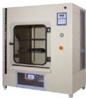
Vertikalna i horizontalna komora za raspršivanje soli Pun spektar opcija za kontinualno i ciklično testiranje