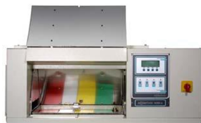
Solarbox - stoni vrhunski xenon tester (4 modela)

Zadržavamo pravo na izmene u opremi i sistemima u skladu sa napretkom tehnologije i modifikacijama vrednosti parametara u skladu sa tim.